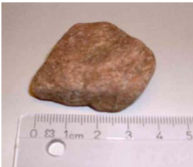
Перекачивает камешки этого размера. Масштаб 1:1